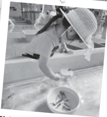
館内では金魚すくいもできます！

外出時の休憩スポットとして利用しやすくなります。 金魚の館は、町の魅力を発信する拠点であるとともに、家族連れや、子どもたちなどの地域の皆さんや観光客が気軽に立ち寄れる憩いの場です。