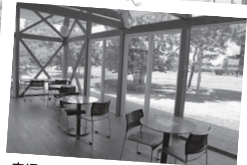
広場には一休みできるカフェも併設！