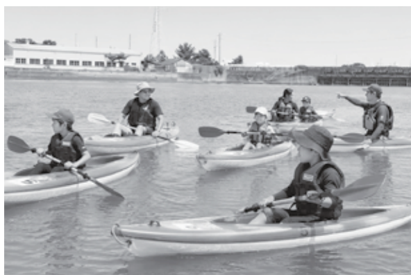
▲マリンスポーツも安全に楽しめるように

また、マリンスポーツや各種スポーツイベント、体育館や屋外活動時の暑さ対策として活用し、より快適な活動環境の確保を図ります。