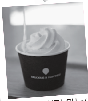
遊んだ後は、ソフトクリームでクールダウン